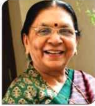
श्रीमती आनन्दी वेन पटेल सहस्रमहिा सञ्जपात उत्तर प्रदेश