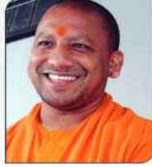
श्री योगी आदित्यनाथ माननीय मुख्यमन्त्री उत्तर प्रदेश