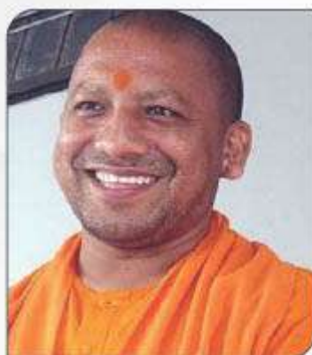
श्री योगी आदित्यनाथ