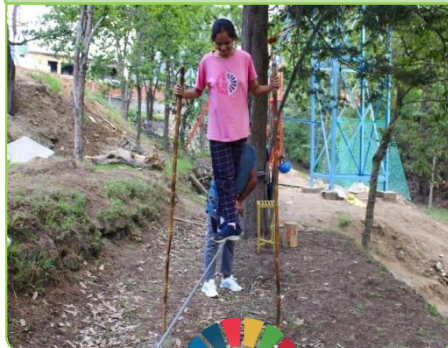
BALANCING ON TIGHT ROPE