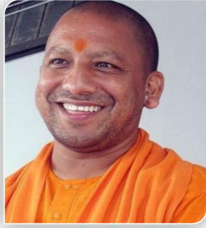
श्री योगी आदित्यनाथ