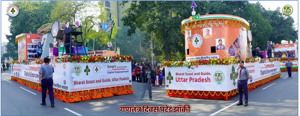
गणतंत्रदिवस परेड झांकी