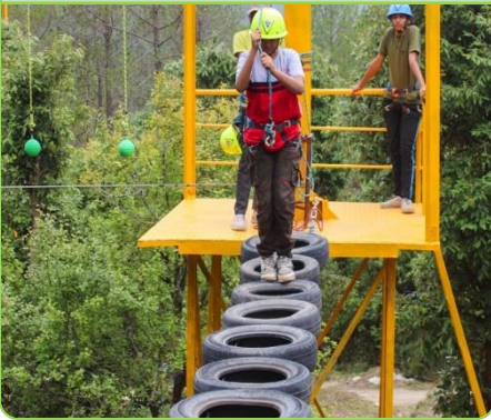
HORIZONTAL TYRE BRIDGE